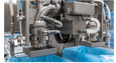
Válvula curvada 90° con receptor de goteo