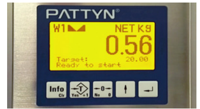
Controlador de pesa de nueva generación