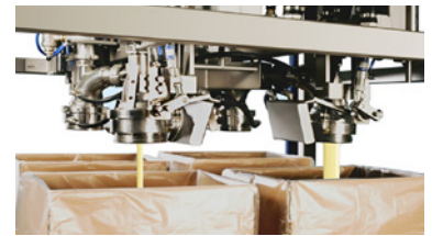
Lenado rápido y lento