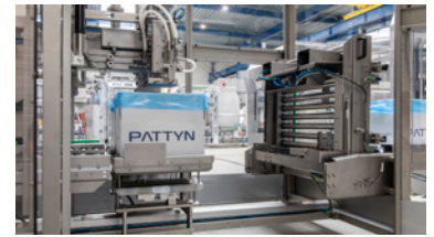
Cinta de alimentación inclinable para una fácil limpieza