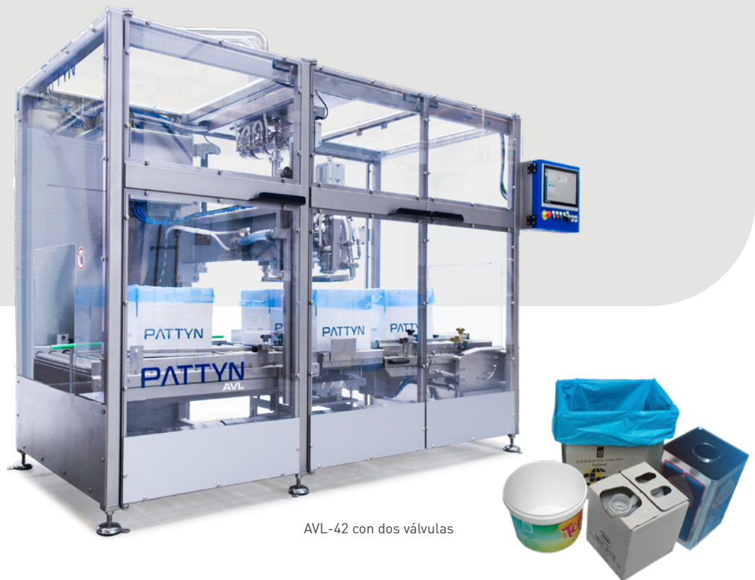
AVL-42 con dos válvulas

COMBINA ALTA VELOCIDAD Y PRECISIÓN CON MÁXIMA ACCESIBILIDAD DE LIMPIEZA